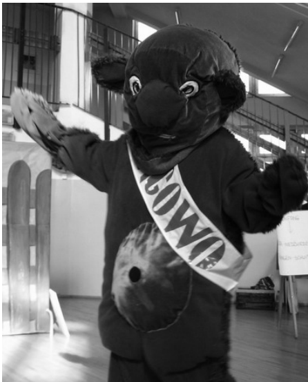
Mrągowski Kłobuk rozweselał wszystkich uczestników Przygody

Urząd Miejski, Hurtownia Traper, ZWiK, Gospodarstwo Agroturystyczne T.T Jankowskich w Polskiej Wsi, Sklep Bajka, Piekarnia J. Łuńskiego, Piekarnia ELVIS, Zakład Stolarski STOLMEX G. Brudzyńskiego. Ponadto w organizacji targów pomógł Referat Strategii, Rozwoju, Promocji i Integracji Europejskiej.