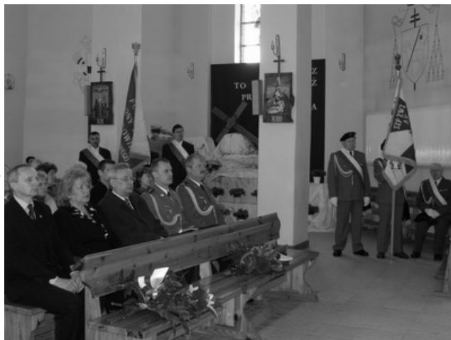
Przedstawiciele władz, kombataneci, policjanci, działacze i mieszkańcy spotkali się na uroczystościach katyńskich.