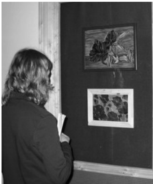
Na zdjęciu: Prace cieszą się dużym zainteresowaniem wśród zwiedzających wystawę.

Właśnie dorobek tej ostatniej można oglądać w CKiT. Wernisaż prac pod nazwą „Barwy Ziemi” traktuje o tym, co wiąże się z przyrodą i otoczeniem człowieka. Prace wykonane są z materiałów naturalnych. Uroczyste otwarcie odbyło się 29 kwietnia.