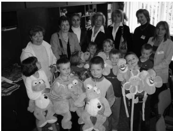
Mali goście z prezentami od Burmistrza

- To bardzo miły dzień. Dziś dostałam pistolecik z cukierkami i grę. Pewnie moja siostra mi ją teraz instaluje.