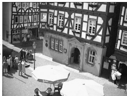
Na tym rynku odbywa się Gallus Markt. Mragowianie mają możliwość uczestniczyć w tej imprezie.

obchodzone od pół wieku. Więcej informacji na temat wymiany partnerskiej można uzyskać w mragowskim urzędzie lub pod nr telefonu 741 2461.