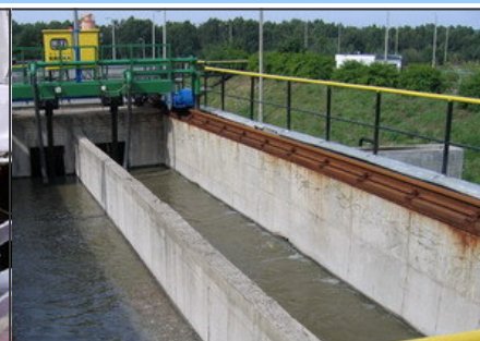
Mrągowska oczyszczalnia już wkrótce doczeka się modernizacji