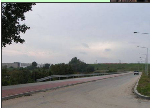
Droga, łącząca os. Mazurskie z ul. Okulickiego