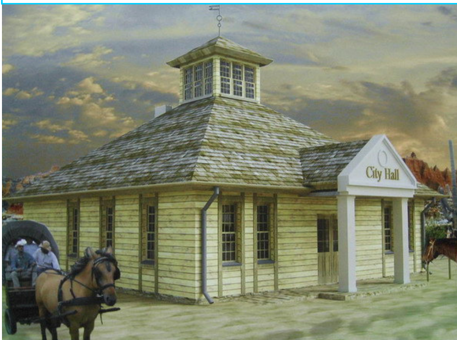
Na zdjęciu budynek Ratusza, który będzie pełnił funkcję sali kinowej, ekspozycyjnej i konferencyjnej