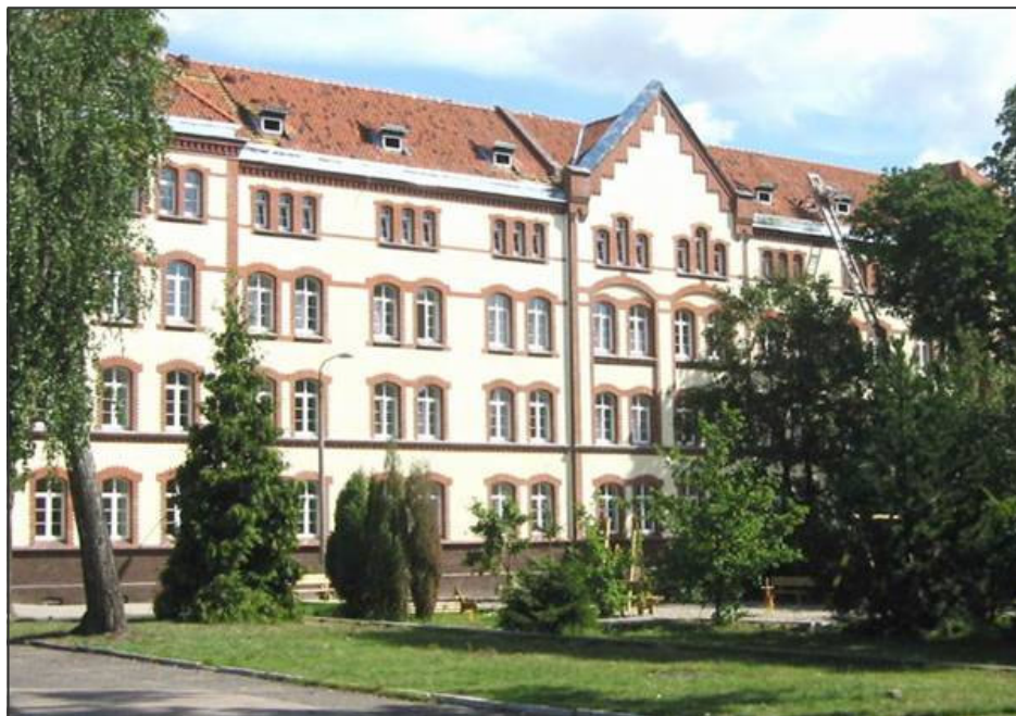
Nowe mieszkania komunalne, socjalne i TBS rozwiązały problemy mieszkaniowe wielu rodzin.

> Utworzono, w 2004 r., podstrefę mrągową Warmińsko – Mazurskiej Specjalnej Strefy Ekonomicznej, w której działalność prowadzą trzy Firmy, cztery są w trakcie rozpoczęcia inwestycji, a dalsze dwie mają wejść z inwestycjami. Zatrudniają 100 pracowników, a deklarują zwiększenie zatrudnienia do około 500 osób. Również rozwój i wzrost zatrudnienia odnotowały firmy funkcjonujące od wielu lat na naszym rynku.