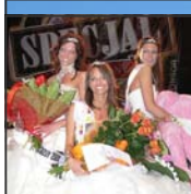
Wybory Miss Warmii i Mazur na stałe wpięły się w kalendarz mrągowskich imprez