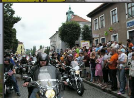
Parada Country to największa tego typu impreza w Polsce