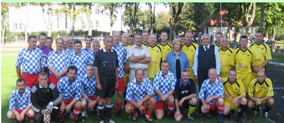
Z okazji 40-lecia istnienia Miejskiego Klubu Sportowego na stadionie miejskim odbył się mecz z Mistrzem Polski Legią Warszawa (na zdjęciu poniżej) oraz pomiędzy Oldboyami „Metalowca” i „Mrągowii”.