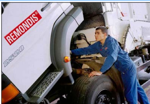
Prywatyzacja PGK to dobra decyzja na przyszłość

> W latach 2003-06 wzrosła ilość podmiotów gospodarczych, wytwórczych i usługowych.