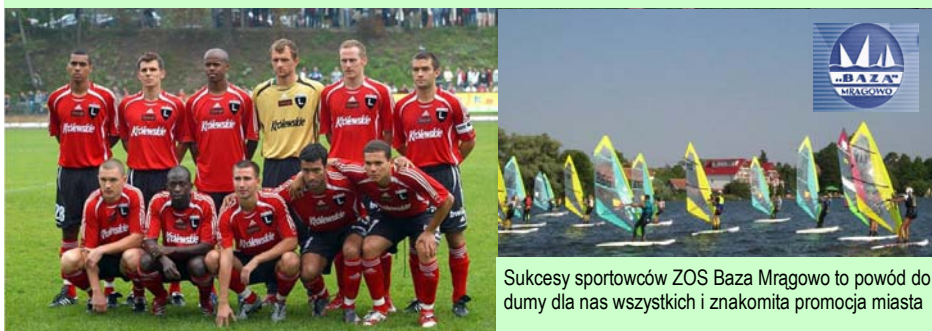
Sukcesy sportowców ZOS Baza Mrągowo to powód do dumy dla nas wszystkich i znakomita promocja miasta

> W wyniku podjętych działań, nasze Miasto, w oparciu o analizę wskaźników ekonomiczno-gospodarczych z 2005 r. zostało zakwalifikowane na obszar o dużym potencjale rozwoju, a także miało czołowe pozycje w ogólnopolskich i regionalnych rankingach samorządów.