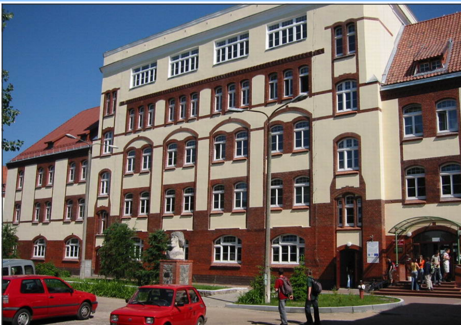
Nowoczesne Gimnazjum wraz z MDK poprawiły warunki nauki uczniów i pracy nauczycieli.