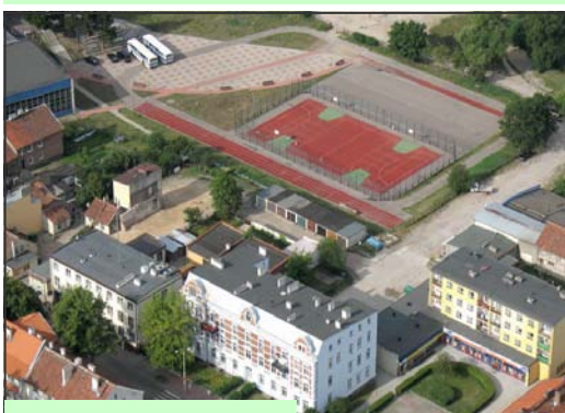
W Zespole Szkół nr 4 na os. Mazurskim wykonano remont dachu