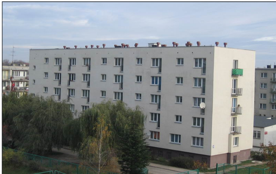
Budynek na ul. Sienkiewicza 16 - tu, po adaptacji hotelu, zamieszkało 39 rodzin, a w byłej stołówce powstała świetlica środowiskowa i Warsztaty Terapii Zajęciowej.