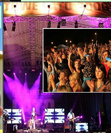
Miasteczko Mrongoville znakomicie sprawdziło się jako miejsce koncertów. Na zdjęciu Koncertowe Lato z RMF FM, zespół Wilki