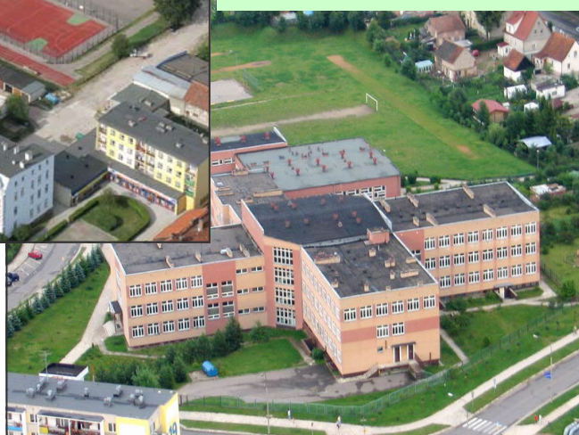
Nowe boiska przy Szkole Podstawowej nr 1 przy ul. Bohaterów Warszawy powstały dzięki pozyskaniu środków z MENiS. Poprawiło to stan bazy sportowej w mieście.

> Bezrobocie zmalało o 1233 osoby i w stanu na 30.09.06 r. wynosiło 1693 oso- by. Duże bezrobocie jest wynikiem nie tylko braku miejsc pracy, ale również oferowanym niskim wynagrodzeniem. Ta sytuacja zaczyna się w sposób naturalny zmieniać na korzyść.