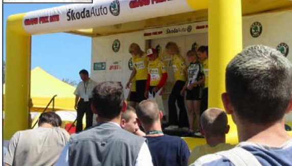
Skoda Lang Team MTB to wyjątkowa, promująca Mrągowo i region impreza, którą szeroko relacjonowała TVP2 i 3.