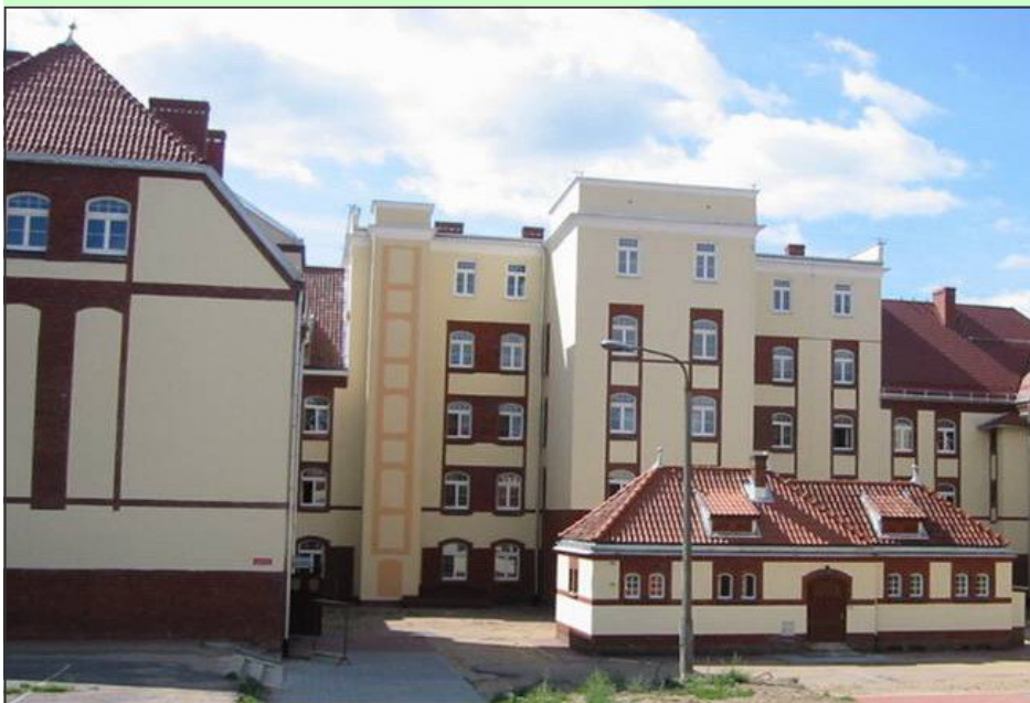
Obok szkoły i MDK mieści się nowa siedziba mragowskich harcerzy.