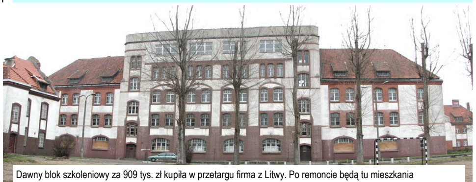
Dawny blok szkoleniowy za 909 tys. zł kupiła w przetargu firma z Litwy. Po remoncie będą tu mieszkania