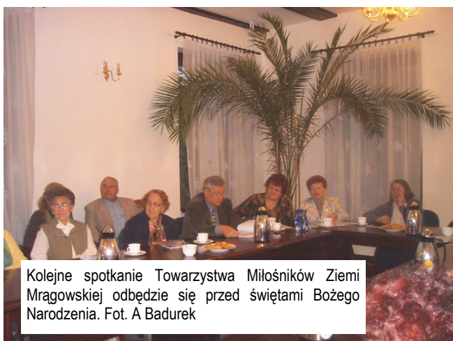
Kolejne spotkanie Towarzystwa Miłośników Ziemi Mragowskiej odbędzie się przed świętami Bożego Narodzenia.

stałe zagościć w tym programie nie tylko jako uczestnik, lecz jako współorganizator imprezy.