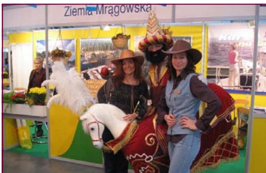
Lajkonik z Krakowa pokochał Ziemię Mrągową