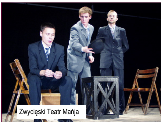
Zwycięski Teatr Mańja