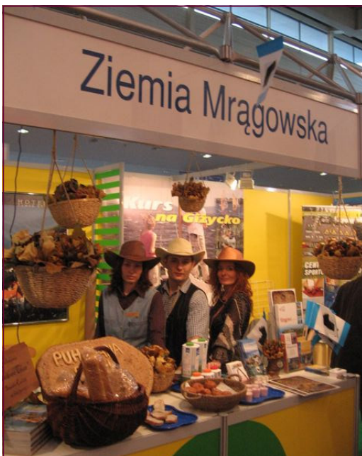
Promocja mrągowskiego stoiska w stylu country