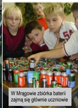
W Mrągowie zbiórka baterii zajmą się głównie uczniowie