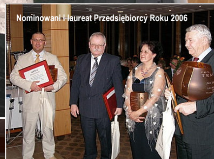
Nominowani i laureat Przedsiębiorcy Roku 2006