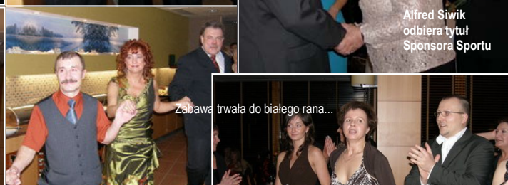
Zabawa trwała do białego rana...