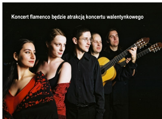
Koncert flamenco będzie atrakcją koncertu walentynkowego