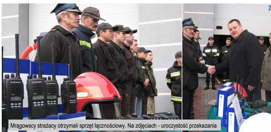
Mrągowscy strażacy otrzymali sprzęt łącznościowy. Na zdjęciach - uroczystość przekazania

Ochotnikom brakowało sprzętu łączności. Mają natomiast jeden z ważniejszych elementów wyposażenia - wymagany w systemie wóz do ratownictwa wodnego, który uratował już życie kilku osobom. Teraz strażakom potrzebne jest jeszcze inne urządzenie, zapewniające łączność,, do tak zwanego selektywnego wywołania - by byli bezpośrednio powiadamiani o akcjach.