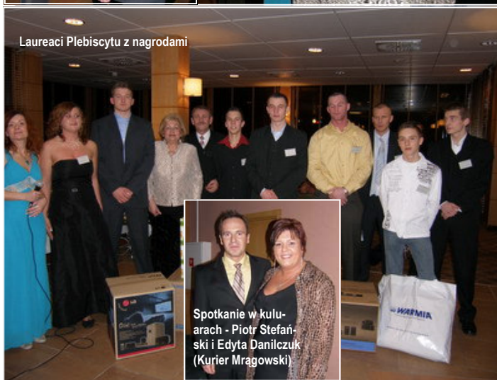
Laureaci Plebiscytu z nagrodami