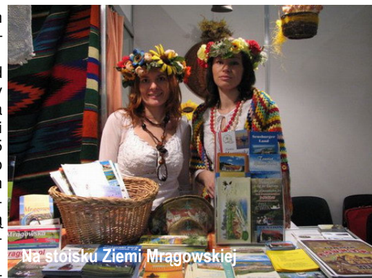
Na stoisku Ziemi Mrągowskiej