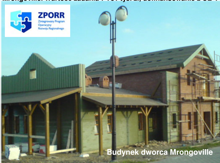
Budynek dworca Mrongoville

Trwa budowa Miasteczka Mrongoville. Już w przyszłym roku odbywać się tu będą imprezy westernowe - na razie powstają traperskie domki, Ratusz, saloon, Mexico Bar, estrada z zapleczem, siedziba szeryfa z więzieniem, i budynek dworca Mrongoville. Wartość zadania 7 781 tys. zł, dofinansowanie z UE 4 500 tys. zł.