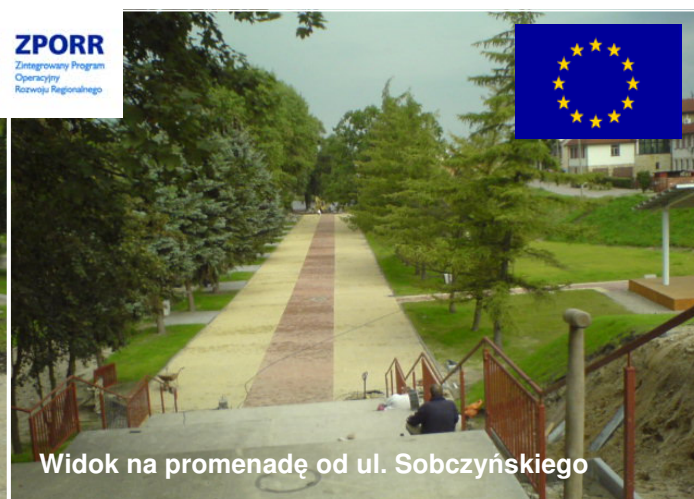
Widok na promenadę od ul. Sobczyńskiego