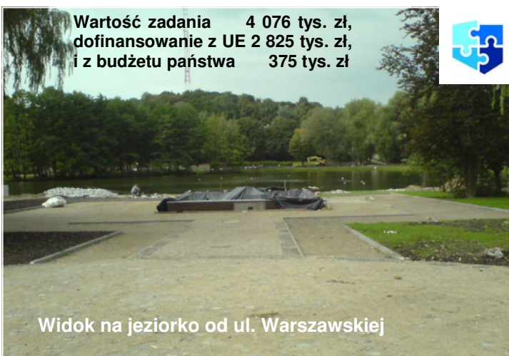
Widok na jezioro od ul. Warszawskiej

Wartość zadania 4 076 tys. zł, dofinansowanie z UE 2 825 tys. zł, i z budżetu państwa 375 tys. zł