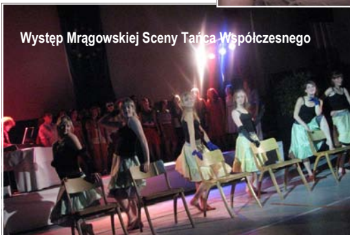
Występ Mrągowskiej Sceny Tańca Współczesnego