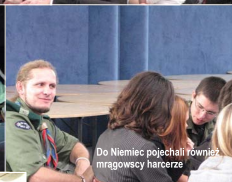
Do Niemiec pojechali również mrągowscy harcerze