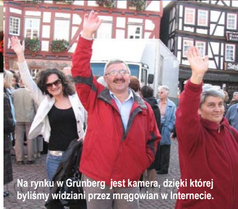
Na rynku w Grünberg jest kamera, dzięki której byliśmy widziani przez mrągowian w Internecie.