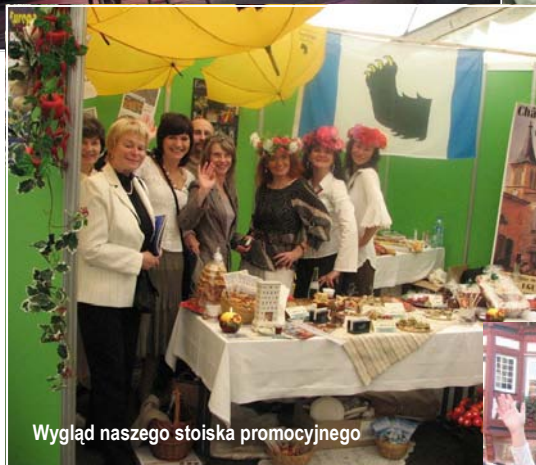
Wygląd naszego stoiska promocyjnego