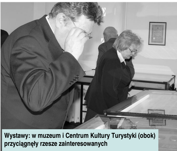
Wystawy: w muzeum i Centrum Kultury Turystyki (obok) przyciągnęły rzesze zainteresowanych