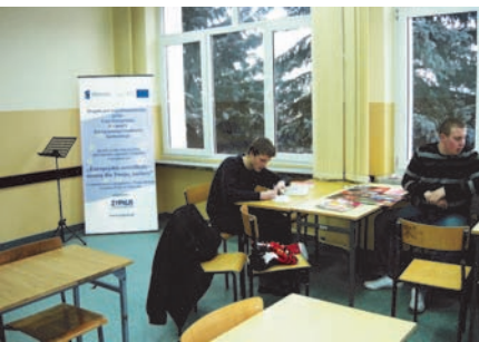
Uczniowie szkolni na zajęciach swój język

Tematyką poszczególnych lekcji było: jedzenie, zawody. Uczniowie wykonywali samodzielnie projekt dot. Walentynek, pisali pocztówki oraz oglądali filmy w oryginalnej wersji językowej. Zajęcia