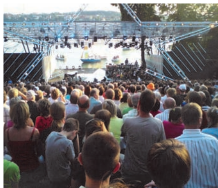
Magazyn Mrągowski nr 3/2009