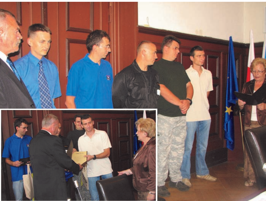
Zawodnicy Pucharu Miast przyjęli od władz Miasta oraz wszystkich obecnych na sesji Radnych gratulacje i podziękowania za swoje zaangażowanie i promocję Miasta.

reprezentujący Mrągowo w Pucharze Miast. Przez kilka miesięcy uczestniczyli w zawodach pomiędzy miastami Polski północnej, odnosząc sukcesy. Wygrali nawet