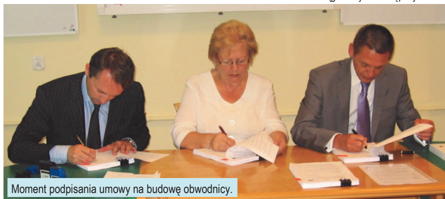
Moment podpisania umowy na budowę obwodnicy.

siężnych okresów zimowych. Rozpoczyna się już we wrześniu br. a jej planowane zakończenie to listopad 2011 r.