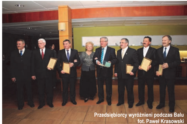
Przedsiębiorcy wyróżnieni podczas Balu

pracownicy wysoko wykwalifikowani, wśród nich kadra inżyniersko-techniczna. Kadra jest ustabilizowana, czego mogą pozazdrościć mi inne przedsiębiorstwa. Mamy bardzo dobrze wyposażone biuro konstrukcyjne. W ubiegłym roku wyprodukowaliśmy 531 ładowaczy czołowych do różnego rodzaju typów ciągników. Nasze wyroby zasilają rynek krajowy, eksportujemy ładowacze do Litwy, Estonii czy Rumunii.