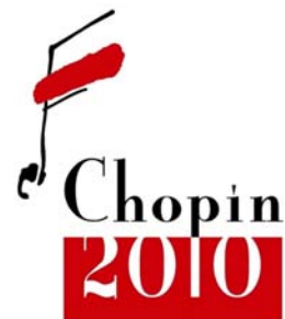
200. Rocznica Urodzin Fryderyka Chopina

Zapraszamy Państwa również do obejrzenia wyjątkowej Wystawy Plakatu Chopinowskiego, która prezentowana będzie jednocześnie w 200 placówkach na terenie całej Polski. Autorami plakatów są znakomici polscy artyści graficy. Wystawa obejmuje kolekcję 35 plakatów wyłonionych w drodze konkursu, zorganizowanego w 2009 roku przez Mazowieckie Centrum Kultury i Sztuki w Warszawie we współpracy z Akademią Sztuk Pięknych w Warszawie oraz Instytut „Sztuka Mediów”. Wystawę będzie można oglądać do końca kwietnia w CKiT.