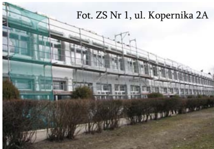
Fot. ZS Nr 1, ul. Kopernika 2A

Do marca 2010r. wykonano remont i wymianę instalacji wewnętrznych w pełnym zakresie. Roboty potrważają do czerwca 2010r.