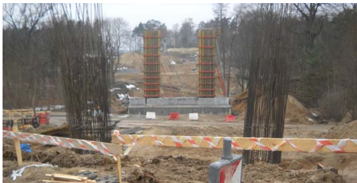
Fot. Budowa estakady nad rzeką Dajną i dojazdem do Miasteczka Westernowego Mrongoville

Trwa budowa zachodniej obwodnicy Mrągowa