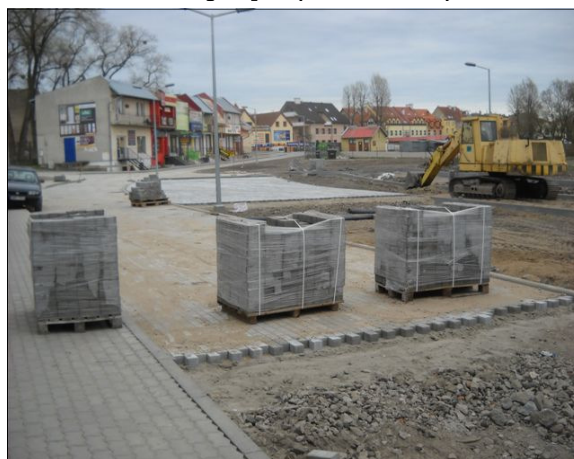
Remont ul. Moniuszki