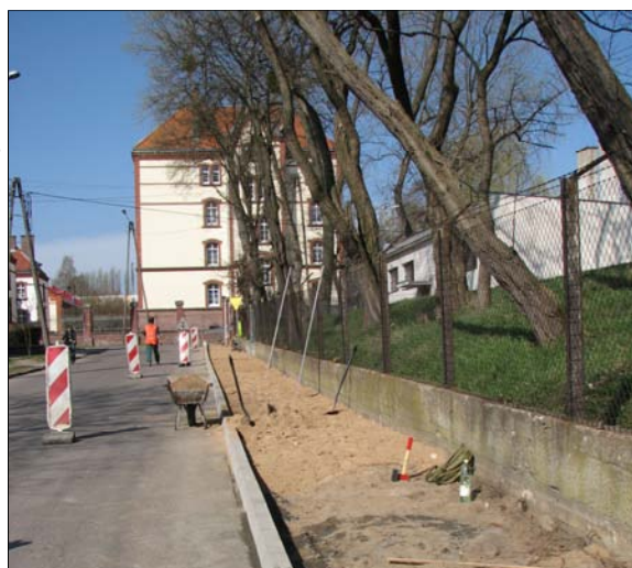
Remont ciągów pieszych ul. Dziękczynna