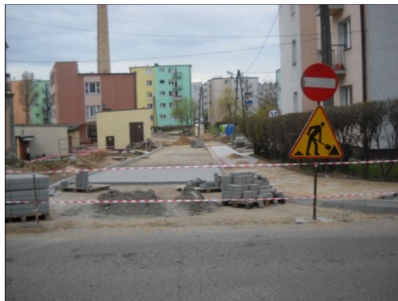
Remont ulic osiedla Parkowe

Firma „POLGER sp. z o.o z Mrągowa rozpoczęła remont ciągów pieszych przy ulicach: Dziękczynna, Słoneczna, Krzy- wa. Trwające przez kilka mie- sięcy prace zostaną podzielone na kilka etapów. W trakcie każdego z nich remontowany będzie inny fragment ulic. W ramach zadania przeprowadzo- ny zostanie remont chodni- ków, nawierzchnia zostanie wykonana z kostki betonowej „POLBRUK”. Do końca zbliża się inwestycja przebudowy ul. Moniuszki wraz z parkingiem.