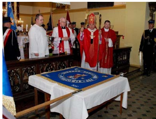
Magazyn Mrągowski nr 5/2010