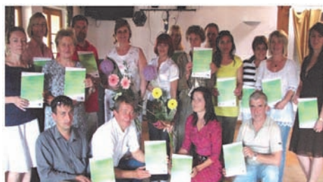
Zakończenie kursu „Lekcja projektowania ogrodów”, projekt był współfinansowany przez Unię Europejską w ramach Europejskiego Funduszu Społecznego.

- „Czego Jaś się nie nauczy, tego Jan nie będzie umiał” - 341 tys. zł . W ramach projektu w Przedszkolu Publicznym Nr 1 i Nr 2 oraz Przedszkolu Niepublicznym „Kubuś” zorganizowane zostały zajęcia logopedyczne, zajęcia gimnastyki korekcyjnej, zajęcia badawczo – dydaktyczne pn. „Miłośnik mazurskiej przyrody”, zajęcia plastyczne pn. „Upiększanie świata” oraz zajęcia dla dzieci szczególnie uzdolnionych pn. „Razem z sową ruszam