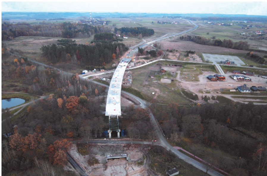
EST-4 (estakada) - Obiekt ma na celu przeprowadzenie ruchu samochodowego w ciągu DK-59 nad rz. Dajną, ul. Młynową i dojazdem do Mrongoville.

Wykonano szereg miejskich inwestycji, z tego zakończono m.in.: przebudowę ulic i placów osiedla Parkowa - 1,505 mln zł, przebudowę dróg w ul. Moniuszki - 1,983mln zł, Podmiejskiej - 418 tys. zł, Polnej - 398tys zł, Sobczyńskiego - 424 tys. zł, ulic os. Mazurskie - 1,661 mln zł, ciąg pieszo-rowerowy w ul. Młodkowskiego do cmentarza - 1,171 mln zł, budowa kanalizacji deszczowej od ulicy Wojska Polskiego przez Żoł-