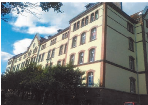
Budynek komunalny na terenie byłych koszar.

mieszkań w celu ich dostosowania do wielkości rodziny. Wykonano duży zakres remontów budynków mieszkalnych i mieszkań, poprawiając ich stan techniczny, standard zamieszkania i przywracając historyczny wygląd, na co wydano 3,556 mln zł. Sprzedano deweloperom pod budownictwo mieszkaniowe przygotowane tereny inwestycyjne, powiększając w ten sposób ofertę i dostępność mieszkań na mrągowskim rynku. Miasto zbywało w przystępnych cenach mieszkania do remontu, z zasobu komunalnego, będące ostatnimi we wspólnotach.