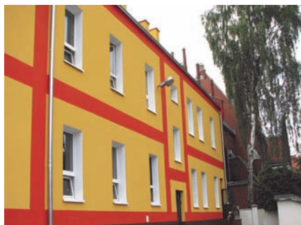
Budynek MOPS po zakończonym remoncie

Całkowita wartość inwestycji – 5 870 540 zł. Zakończenie inwestycji planowane jest do końca 2011 r. Zadanie obejmuje m.in.: termomodernizację budynku MOPS, ZS Nr 1 przy ul. Kopernika 2A, ZS Nr 4, Przedszkola Niepublicznego „Kubus”.