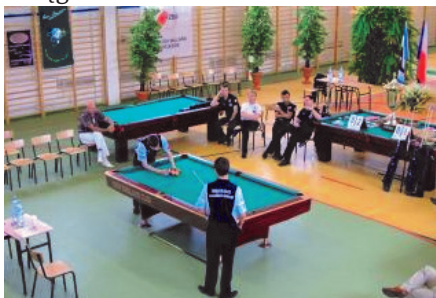
Na hali odbył się Klubowy Puchar Polski w Pool Bilard - Oskar Cup - MRĄGOWO 2008.

nie obiektu dla działań ukierunkowanych na aktywizację grup zagrożonych wykluczeniem społecznym, poza tym z hali korzystają uczniowie mrągowskich szkół.