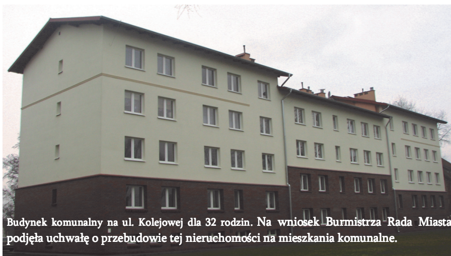
Budynek komunalny na ul. Kolejowej dla 32 rodzin. Na wniosek Burmistrza Rada Miasta podjęła uchwałę o przebudowie tej nieruchomości na mieszkania komunalne.

Oddano do użytku 40 nowych mieszkań komunalnych. Kupiono od Starostwa hotel przy ul. Młodkowskiego w celu jego przebudowy na wielorodzinny budynek komunalny z mieszkaniami przystosowanymi dla osób starszych i niepełnosprawnych. Projekt przebudowy zgłoszony zostanie w 2011r. do rządowego programu dopłat w celu uzyskania dofinansowania do tej inwestycji. Ilość oddanych mieszkań komunalnych daje nam jedno z pierwszych miejsc w regionie i w kraju (w kraju statystycznie 1 gmina oddaje 1 mieszkanie w roku). Średni czas oczekiwania na