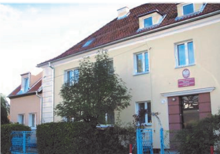
Wyremontowany budynek Przedszkola „Bajka”

Powiększono liczbę miejsc w przedszkolach o 4 oddziały, wychowaniem przedszkolnym objęto większą liczbę dzieci. Przebudowano Przedszkole Publiczne "Bajka" - 759 tys. zł oraz pomieszczenia przedszkola „Kubus” na dwa dodatkowe oddziały przedszkolne - 77 tys. zł.