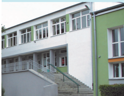
Szkoła Podstawowa w Zespole Szkół Nr 1 przy ul. Kopernika po termomodernizacji.