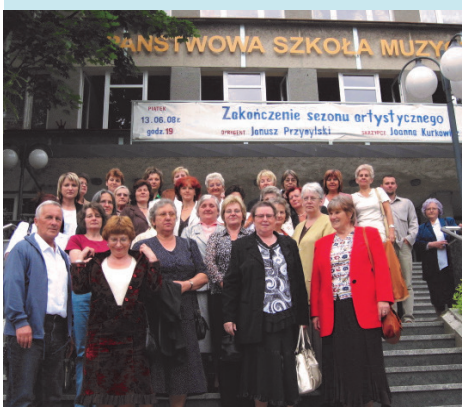
Uczestnicy projektu „Od lokalnej inicjatywy do pełnej kultury”.