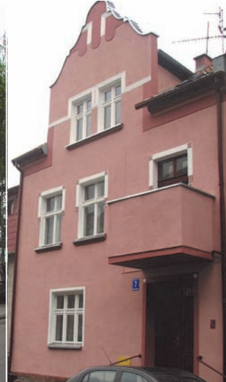
Zakończone remonty budynków komunalnych na ulicy Roosevelta 4 i 10 i Bohaterów Warszawy 7 (kolejno na zdjęciach).