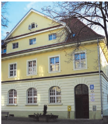
Środowiskowy Dom Samopomocy powstał w zaadaptowanym, przez Miasto, na ten cel budynku przy ulicy Królewieckiej 34.

To pierwsza w mieście tego typu placówka, wspierająca osoby potrzebujące pomocy w przezwyciężaniu trudnych sytuacji życiowych.