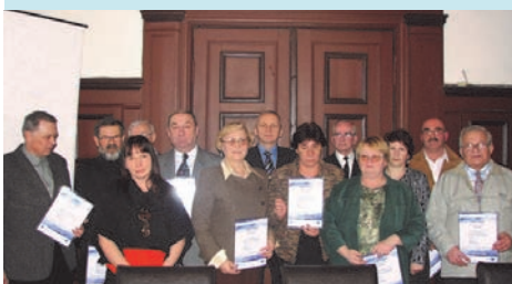
Zakończenie I edycji kursu „Ja i mój komputer”.