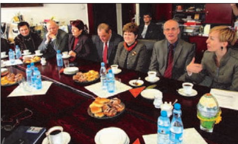
Delegacja z Druskiennik debatowała w gabinecie Burmistrza Miasta nad realizacją wspólnych projektów z kierownikami Referatów UM w Mrągowie i jednostek podległych.

Z wizytą roboczą w Mrągowie przebywali przedstawiciele litewskiego miasta Druskienniki. Samorządowcy zwiedzali nasze miasto oraz poznawali unijne programy wspierające inwestycje i rozwój turystyki. Wszystko po to, by w przyszłości podpisać umowę partnerską w celu wspólnego pozyskiwania funduszy z Unii Europejskiej.