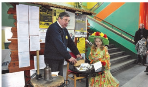
Towarzystwo Numizmatyczne przyłączyło się do akcji „Być dla innych”

Impreza odbywała się już po raz jedenasty. Na scenie wystąpiło około trzystu artystów z MDK i placówek wspierających akcję: wszystkie mrągowskie przedszkola, ZS nr 1, CKiT, Warsztaty Terapii Zajęciowej, Dom Pomocy Społecznej, ZSS, Świetlica Środowiskowa "Gniazdo", Studio Wokalne "Sukces" i nasze grupy z MDK. Wszyscy po występach otrzymali poczęstunek ufundowany przez sponsorów akcji. Symbolem tak jak każdego roku było uśmiechnięte słoneczko, które każdy mógł zakupić przed wejściem na widownię. W holu można było obejrzeć wystawę artystyczną oraz uczestniczyć w warsztatach rękodzielniczych MDK i warsztatach florystycznych Stowarzyszenia "Zielone Dzieci". Tego dnia było też z nami Polskie Towarzystwo Numizmatyczne, które obdarowywało żetonikiem na szczęście. Byli też niezawodni wspaniali wolontariusze ze Stowarzyszenia Amicus, ZS nr 2, ZSZ oraz MDK. Przy stoiskach można było zakupić stroiki wielkanocny i pyszne ciasta - wypieki rodziców i uczniów ZS nr 2.