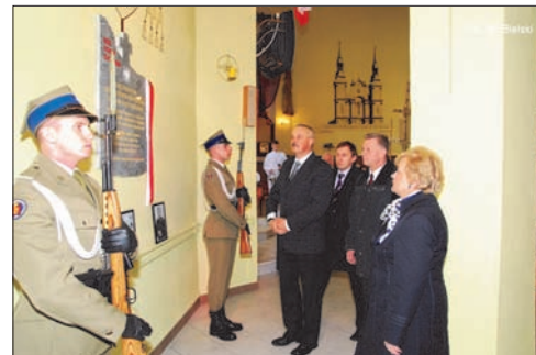
W uroczystości odsłonięcia tablicy uczestniczyli samorządowcy, żołnierze, policjanci, strażacy, harcerze i kombataneci.

- Módlmy się jednocześnie do miłosiernego Boga, aby wzbudził nowych synów i córki Ojczyzny, pragnących służyć ofiarnie i odważnie ludziom nowych czasów - napisali biskupi. - Niech ta katastrofa umocni wzajemne więzi w naszej Ojczyźnie, Europie i świecie. Niech świadomość tej wspólnoty pozwoli nam zespolić serca, ideały i czyny, by nasz świat stawał się coraz bardziej ludzki. We mszy świętej uczestniczyły poczty sztandarowe, żołnierze WOSzK Mrągowo, funkcjonariusze Policji i Straży Pożarnej, harcerze, kombataneci, samorządowcy, powiatu i gmin.