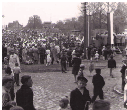
Obecny Plac Piłsudskiego w dniu 1 maja 1961, zdj. przekazała Biblioteka Miejska

- Jeżeli uzbieramy odpowiednią ilość zdjęć Mrągowa zrobimy wystawę w mrągowskim Muzeum - wyjaśnia Wróbel. - Skany zdjęć znajdą się również w wirtualnej galerii na stronie Mrągowskiego Centrum Informacji Turystycznej. Organizatorzy akcji liczą, że projekt wzbudzi zainteresowanie mieszkańców i pozwoli na ukazanie powojennego Mrągowa oraz życia jego mieszkańców.