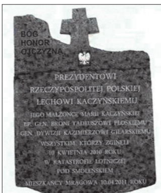
Tablica upamiętniająca ofiary tragedii pod Smoleńskiem ufundowana przez samorząd Miasta Mrągowo