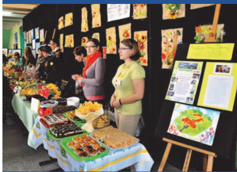
Kiermasz organizowany podczas imprezy „Być dla innych”