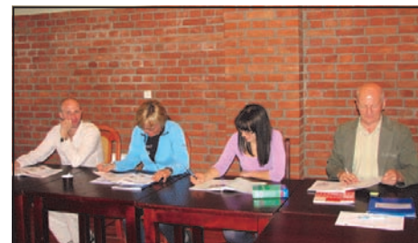
Uczestnicy kursu podczas zajęć w Mrągowie.

Biuro projektu: Urząd Miejski w Mrągowie, ul. Królewiecka 60 A, pokój nr 02, tel. 89 741 90 40.