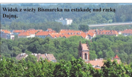
Widok z wieży Bismarcka na estakadę nad rzeką Dajną.

Przy wieży Bismarcka otwarty będzie również grill-bar.