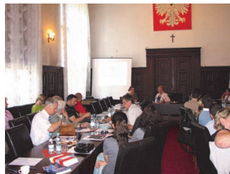
W spotkaniu uczestniczyło ok.30 przedsiębiorców i lokalne media.

siębiorcom główne 4 zadania, które realizowane będą w ramach konkursu, do których należą: "Jak rozmawiać i współpracować?" - opracowanie i wdrożenie lokalnie obowiązującego dokumentu "Zasady komunikacji i współpracy"; "Przestrzeń publiczna - wspólna sprawa" - opracowanie założeń prowadzenia konsultacji społecznych ze szczególnym uwzględnieniem działań dotyczących przestrzeni publicznej; "Otwarta gmina" - wprowadzenie zwyczaju spotkań mieszkańców z radnymi i władzami Miasta. Dyskusja z udziałem członków komisji Rady Miejskiej w Mrągowie; "Co się będzie działo w naszym Mieście?" - organizacja spotkania z Burmistrzem Miasta Mrągowo w sprawie projektu budżetu Miasta na rok 2012.