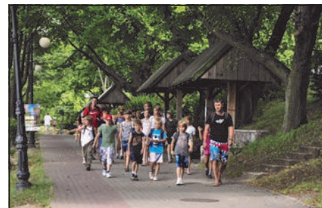
Promenada nad Jeziorem Czos

ZHP Hufiec Mrągowo , w okresie od 27.06. do 1.07.2011 r. w godz. od 9.30 do godz. 15- tej, w obiektach Zespołu Oświatowo - Sportowego „Baza” w Mrągowie, będzie prowadził obóz harcerski, dla 20 dzieci w wieku od 8 do 13 lat. Dzieci będą miały zapewnione po-