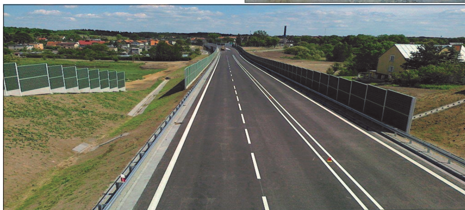
Zachodnia obwodnica Mrągowo w drodze krajowej nr 59.