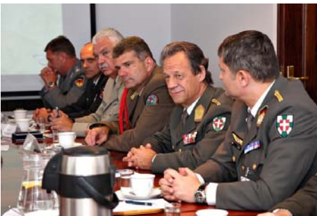
Obrady dowódców stołecznych garnizonów Państw Europy Wschodniej na WOSzK-u.

Po zakończeniu obrad, uczestnicy wzięli udział w uroczystości nadania nowo odrestaurowanej Sali Konferencyjnej imienia gen. dyw. Kazimierza Gilarskiego. Następ-