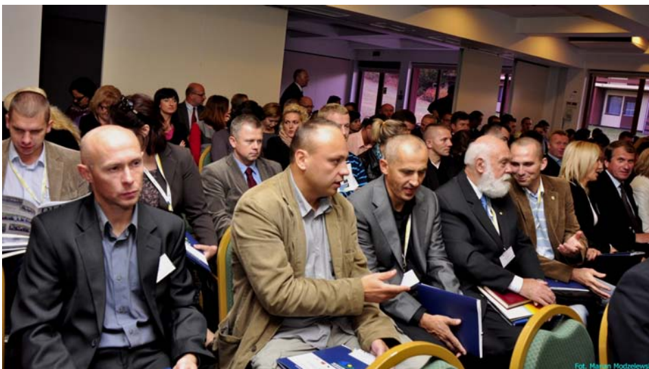
Ten projekt został zrealizowany przy wsparciu finansowym Komisji Europejskiej. Projekt lub publikacja odzwierciedlają jedynie stanowisko ich autora i Komisja Europejska nie ponosi odpowiedzialności za umieszczoną w nich zawartość merytoryczną

Na konferencję licznie przybyli przedstawiciele samorządów, ośrodków sportowych, klubów i stowarzyszeń z całego Województwa Warmińsko – Mazurskiego, łącznie ok.130 osób.