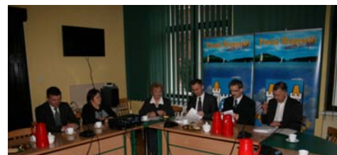
Umowę z wykonawcą sieci światłowodowej podpisano 18 marca 2011.

Łatwiejsza komunikacja pomiędzy instytucjami publicznymi to tylko jedno z założeń projektu. Zostaną także podłączone urządzenia dostępowe dla mieszkańców (PIAP - Public Internet Access Point - publiczny punkt dostępu do internetu). Wdrożenie projektu pozwoli na efektywną i swobodną wymianę informacji pomiędzy Urzędem Miejskim a mieszkańcami, turystami i inwestorami. Klient, dzięki synchronizacji systemów informatycznych zainstalowanych w PIAPach, będzie miał łatwy dostęp do elektronicznego załatwienia swoich spraw w Urzędzie. Dzięki wdrożonym rozwiązaniom mieszkańcy Mrągowo będą mieli również możliwość uzyskania aktualnych informacji z zakresu wydarzeń kulturalnych czy inwestycyjnych miasta. Dla turystów i odwiedzających Mrągowo gości PIAPy staną się drogowskazem do sprawnego poruszania się po okolicy. W ramach projektu trwają także prace nad przygotowaniem portalu Miasta Mrągowo. Nowa strona Miasta Mrągowo