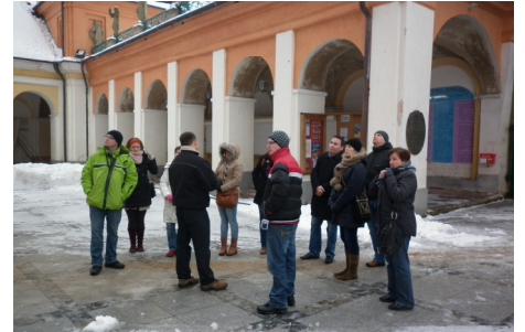
Uczestnicy podczas wyjazdu studyjnego z przewodnikiem.

Udział w projekcie to również ciekawe doświadczenie i sposób do nawiązanie nowych kontaktów. Przekonali się o tym Uczestnicy szkolenia „Informator turystyczny”, które odbywało się w Mrągowie od 03.12.2011 do 29.01.2012. W ramach kursu, który dzięki dofinansowaniu ze środków Europejskiego Funduszu Społecznego, mógł być zrealizowany, jego odbiorcy zdobyli wiedzę teoretyczną, a także praktyczną z zakresu funkcjonowania systemu informacji turystycznej, marketingu, jak również historii, kultury i geografii Warmii i Mazur. W programie szkolenia pojawiły się także dwa wyjazdy studyjne, które zobrazowały treści dydaktyczne oraz poszerzyły wiedzę kursantów o tematy związane z naszym województwem. Szkolenie zakończyło się egzaminem wewnętrznym, a piętnastu uczestników szkolenia zdobyło certyfikat jego ukończenia. Mamy nadzieję, że wiedza którą zdobyli zostanie w pełni wykorzystana i zachęci do studiowania Warmii i Mazur. Uczestnicy kolejnego szkolenia, realizowa-