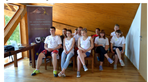
W Centrum Ekologicznym odbyły się warsztaty „Inspirujmy się dla Europy”