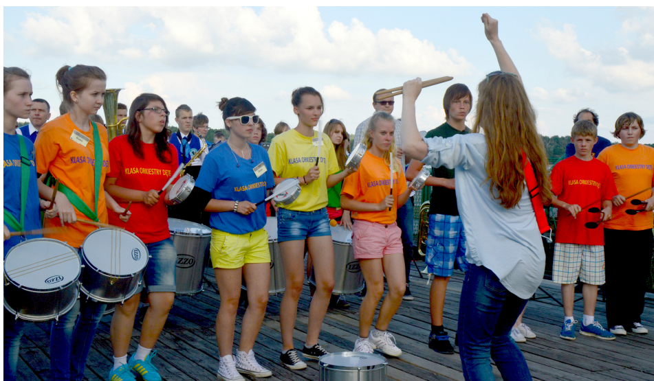
Koncerty orkiestr rozpoczął występ Klasa Orkiestr Dętych w ZS w Łajskach

Za zaangażowanie i pomoc w organizacji obchodów serdecznie Dziękujemy