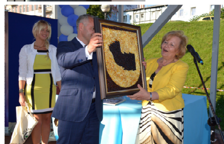
Burmistrz Mragowa otrzymała Herb Miasta wykonany z bursztyńów od Burmistrza Zielenogrodzka