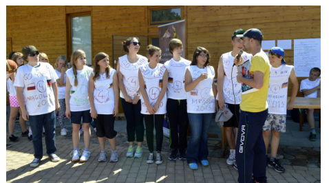
Sportowa integracja na Ekomarlinie, która obejmowała turnieje i zabawy sportowe prowadzone przez MSIS

„Ten projekt został zrealizowany przy wsparciu finansowym Komisji Europejskiej. Projekt lub publikacja odzwierciedlają jedynie stanowisko ich autora i Komisja Europejska nie ponosi odpowiedzialności za umieszczoną w nich zawartość merytoryczną”.