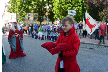
Bractwo Rycerskie „Rota Zaciężna Strażnicy Sensburg” otrzymało klucz do miasta. To oni dowodzili piątkowymi uroczystościami.