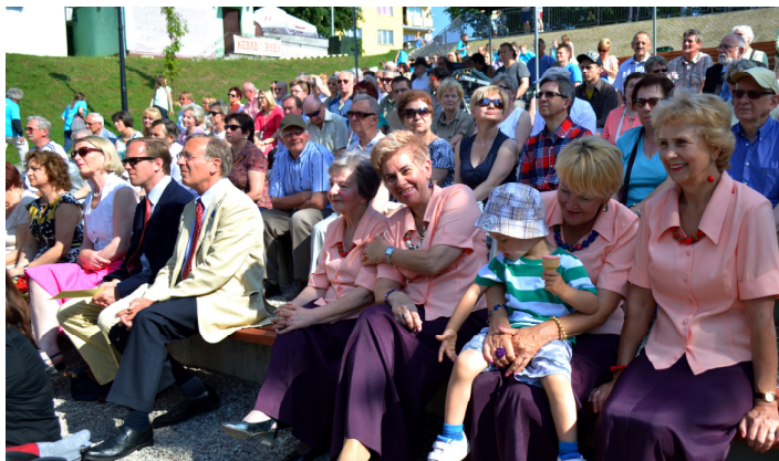
Mieszkańcy Mrągowo podczas oficjalnych obchodów w małym amfiteatrze na Placu Unii Europejskiej

Działanie realizowane w ramach projektu “Inspirujmy się dla Europy” “Let’s Get Inspired for Europe”