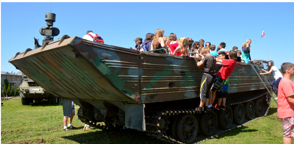
Młodzi goście Jubileuszu zwiedzali Muzeum Sprzętu Wojskowego, gdzie zapoznali się z historią zgromadzonego sprzętu wojskowego oraz brali udział w pikniku wojskowym

Działanie realizowane w ramach projektu „Inspirujmy się dla Europy” „Let's Get Inspired for Europe”