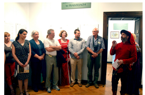
Otwarcie wystawy „Partnerstwo na fotografii”