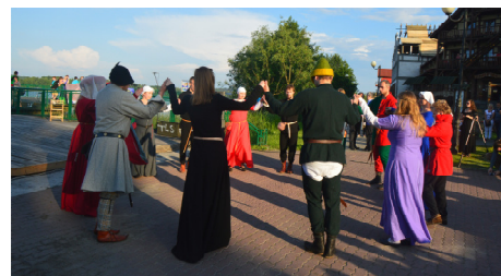
Bractwo umiłało czas przybyłym gościom zabawami średniowiecznymi

„Ten projekt został zrealizowany przy wsparciu finansowym Komisji Europejskiej. Projekt lub publikacja odzwierciedlają jedynie stanowisko ich autora i Komisja Europejska nie ponosi odpowiedzialności za umieszczoną w nich zawartość merytoryczną”.