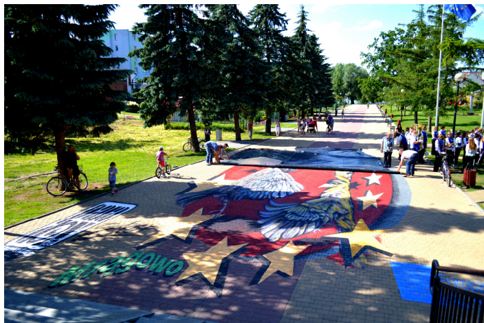
Artystycznym akcentem obchodów jubileuszu partnerstwa, było odsłonięcie obrazu „Partnerstwo w trójkątzie” Grupy Paradox