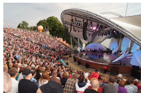
Mazurska Noc Kabaretowa obchodziła w tym roku Jubileusz 15-lecia.

Na początku czerwca obchodziliśmy 20-lecie nawiązania partnerskiej współpracy pomiędzy Mrągowem i niemieckim Grünberg.