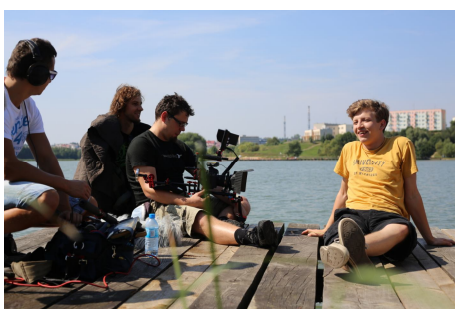
W Mrągowie powstał film fabularny „Kładka”, którego premiera będzie na początku 2014 roku w Mrągowie.

Przy okazji realizacji zakończonych w tym roku międzynarodowego projektu „Sport for Change” powstała marka Sport Zmienia Mrągowo . To idea