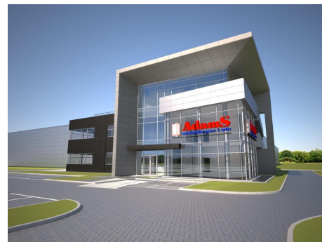
Projekt nowej hali produkcyjnej przy ul. Leśna Droga.

Rozrasta się również mrągowska podstrefa Warmińsko-Mazurskiej Specjalnej Strefy Ekonomicznej. W działającej od 2004 roku strefie powstanie