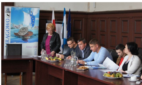
W ramach projektu „Dobry Klimat dla biznesu” w Urzędzie Miejskim się spotkania z przedsiębiorcami i przedstawicielami urzędu.

Nie tylko ściąganie nowych inwestorów, ale także tworzenie przyjaznych warunków do rozwoju lokalnych firm to bardzo ważna kwestia w polityce obecnych władz miasta. Gmina Miasto Mrągowo w ramach projektu „Dobry klimat dla biznesu w Mrągowie” opracowuje właśnie Diagnozę społeczno-gospodarczą.