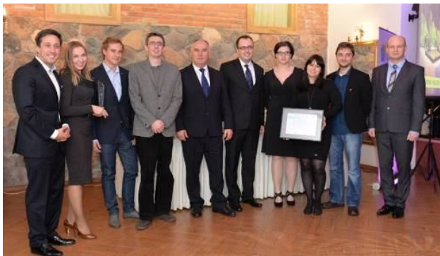
Partnerzy projektu wspólnie odebrali wyróżnienie

Po raz kolejny otrzymaliśmy nagrodę główną w konkursie PRO Warmia Mazury za najlepszy w województwie projekt promocji turystycznej!