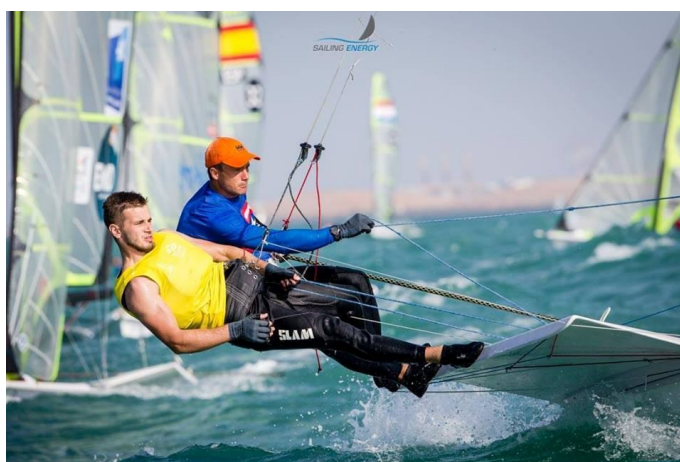
ISAF SAILING WORLD CUP FINAL 2014 ABU DHABI, 27th-30th November 2014

– Byliśmy pewni swoich możliwości ale dotychczasowe wyniki nie dawały nam tego czego chcieliśmy, rósł w nas głód zwycięstwa. Podczas tych regat osiągnęliśmy to co założyliśmy. Jesteśmy