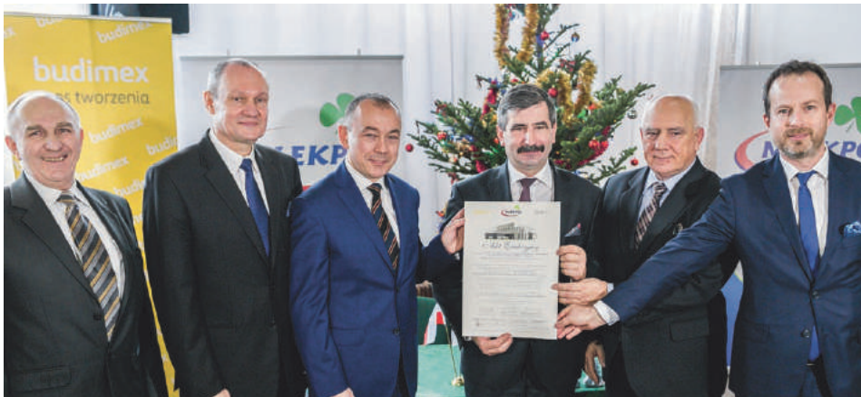
SM MLEKPOL Zakład Produkcji Mleczarskiej w MRĄGOWIE

Zatrudnienie w nowej proszkowni znajdzie najprawdopodobniej 100 osób.