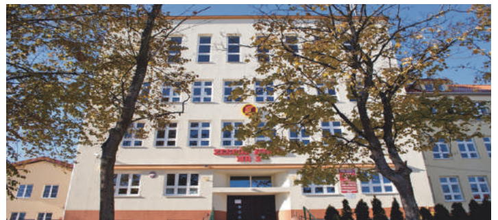
Jubileusz ZS nr 2

Jubileusz mrągowskiego "ogólniaka" to jedyna i niepowtarzalna okoliczność do wzruszeń, wspomnień z lat młodości. To wspaniała okazja do rozpoznania siebie na starych zdjęciach w albumach. Więcej informacji o zjeździe można znaleźć na stronie internetowej szkoły: www.lo1.mragowo.pl lub pod numerem telefonu: 89 741-24-20.