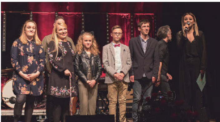
Wyjątkowym punktem Impresji były ZACZAROWANE MARZENIA

Jubileusz Impresji Artystycznych ŚPIEWAJĄCE OBRAZY, zakończył mocny, energetyczny koncert zespołu ORGANEK.