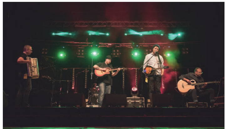
Zespół MILCZENNIK. Zwycięscy konkursu piosenki