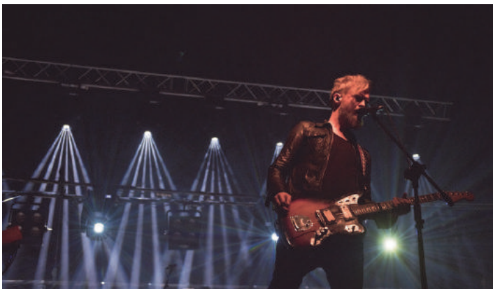
Impresje zakończył koncert zespołu ORGANEK