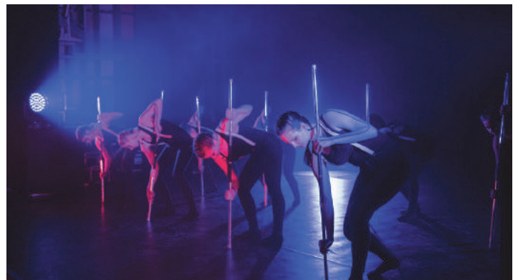
Warsztaty Sztuki Nowocyrkowej poprowadziła grupa Exodus