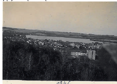
Mrągowo widziane z wieży widokowej 1946 r.