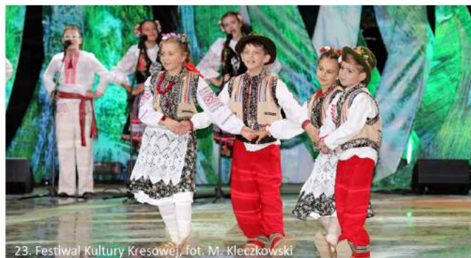
23. Festiwal Kultury Kresowej

W tym roku gościć będziemy z Białorusi: Zespół Pieśni i Tańca „Mozyrzanka” z Mozyrza, Młodzieżowy zespół estradowej piosenki „Wszystko w porządku” działający przy Domu Polskim w Borysowie, Polską Kapelę „Słowianie” powstałą w Raduniu,