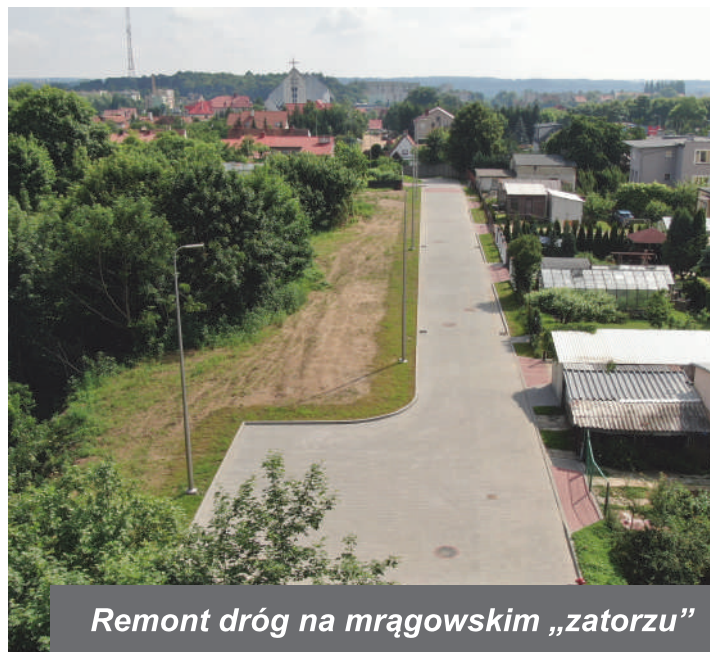
Remont dróg na mrağowskim „zatorzu”