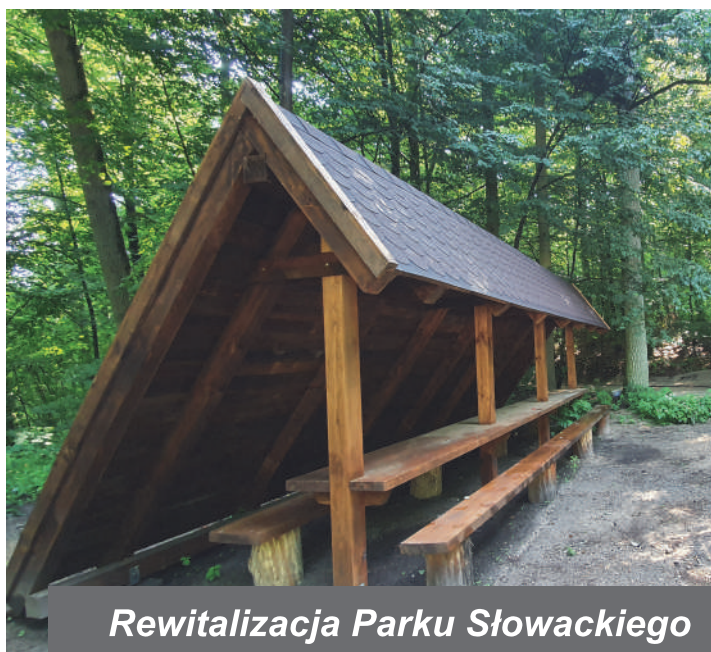
Rewitalizacja Parku Słowackiego