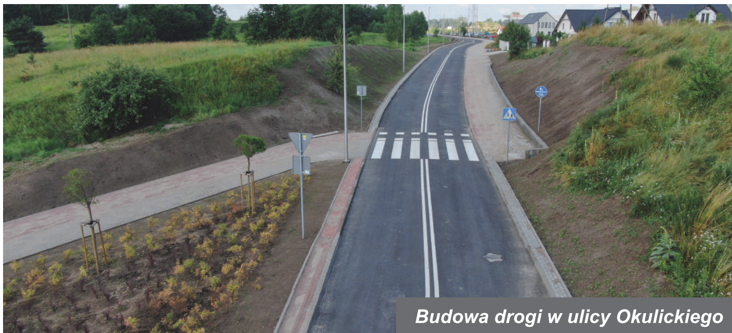
Budowa drogi w ulicy Okulickiego