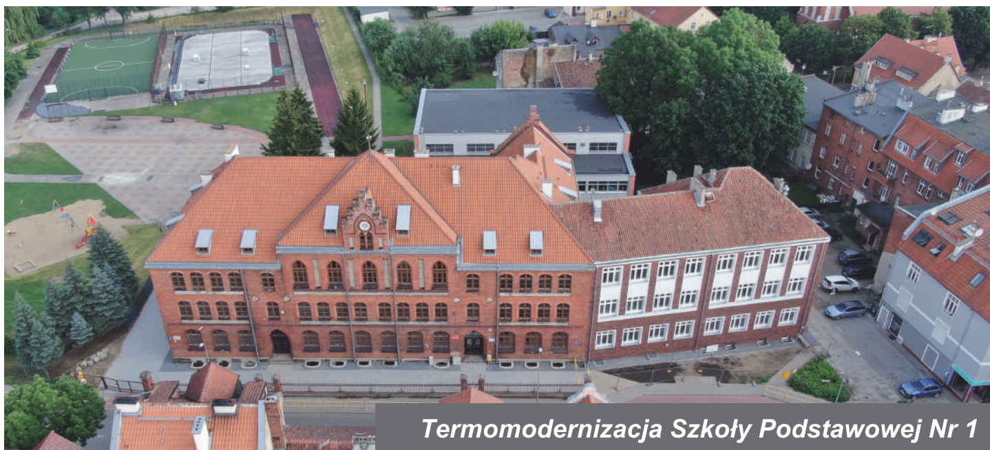
Termomodernizacja Szkoły Podstawowej Nr 1