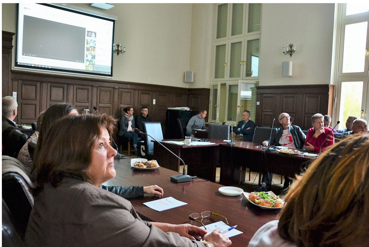
Fot. OH! Móvie Studio