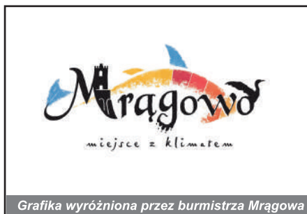
Grafika wyróżniona przez burmistrza Mrągowo

Konkurs, druk oraz kolportaż naklejek organizowany jest w ramach Mrągowskiego Budżetu Obywatelskiego 2020.