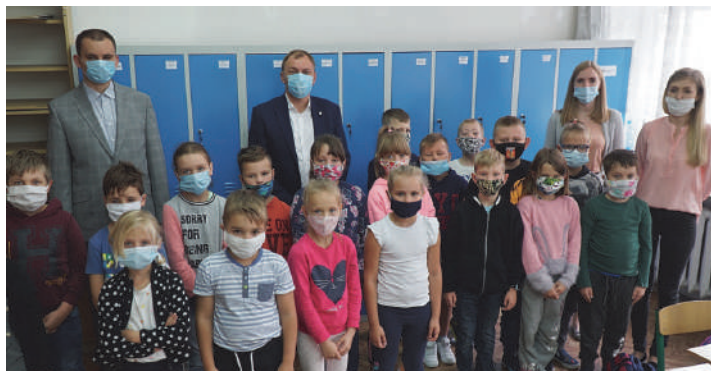
Przekazanie zakupów w ramach SBO w SP Nr 4 w Mrągowie