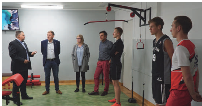
Przekazanie zakupów w ramach SBO w CKZiU w Mrągowie