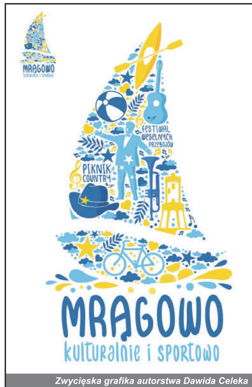
Zwycięska grafika autorstwa Dawida Celeka