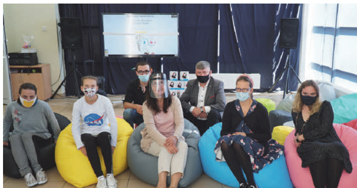
Przekazanie zakupów w ramach SBO w ZSS w Mrągowie