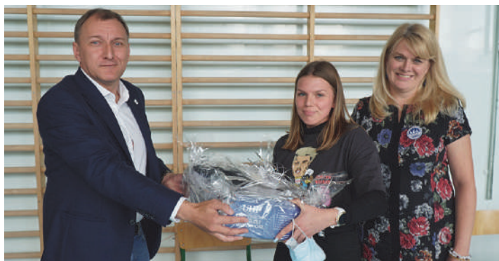
Przekazanie zakupów w ramach SBO w ZOS "Baza" w Mrągowie

Łączna kwota Szkolnego Budżetu Obywatelskiego 2020 to 30 tys. zł, w tym maksymalnie 5 tys. zł na jedną szkołę.